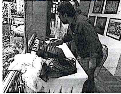
Apoyo logístico presentación Marimba de Bellas Artes y Escuela de músicos militares en las instalaciones del Palacio Nacional de la Cultura.