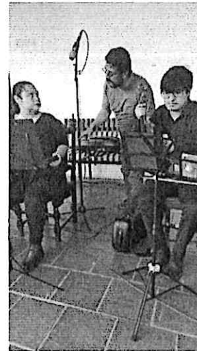
Prueba de sonido del Cuarteto Primavera antes del concierto frente a la Municipalidad de San Pedro Pinula, Jalapa.