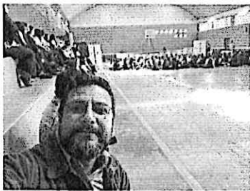
Apoyo logístico en la presentación de propuesta artística la Revuelta, en las instalaciones del INCA