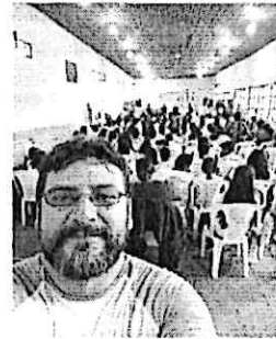
Concierto en el Cuartelón, actual Centro Cultural Mazatenango