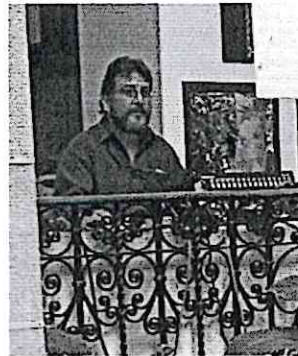
Apoyo logístico presentación Marimba de Bellas Artes y Escuela de músicos militares en las instalaciones del Palacio Nacional de la Cultura.