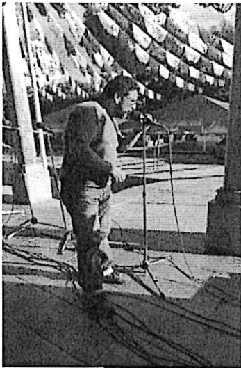
Prueba de sonido del Cuarteto Primavera antes del concierto frente a la Municipalidad de San Pedro Pinula, Jalapa.