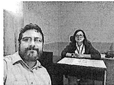
Participación en la entrega de libros de Editorial Cultura en la Escuela Urbana No. 43 Pedro José Valenzuela, Castillo Lara zona 07