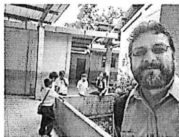
Participación en la entrega de libros de Editorial Cultura en la Escuela Urbana No. 43 Pedro José Valenzuela, Castillo Lara zona 07