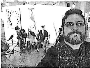
Ensayo Abierto del Cuarteto Primavera en las instalaciones del Palacio Nacional de la Cultura