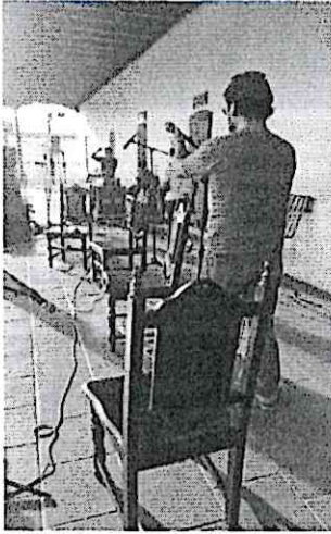
Prueba de sonido del Cuarteto Primavera antes del concierto frente a la Municipalidad de San Pedro Pinula, Jalapa.