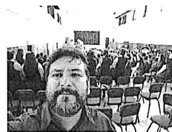
Apoyo logístico en la presentación de propuesta artística la Galería, en las instalaciones del Belén