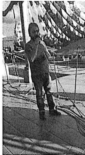
Prueba de sonido del Cuarteto Primavera antes del concierto frente a la Municipalidad de San Pedro Pinula, Jalapa.