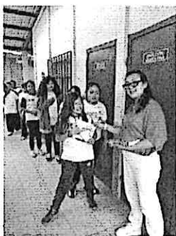
Participación en la entrega de libros de Editorial Cultura en la Escuela Urbana No. 43 Pedro José Valenzuela, Castillo Lara zona 07