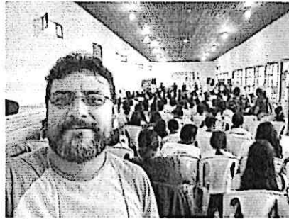
Concierto en el Cuartelón, actual Centro Cultural Mazatenango