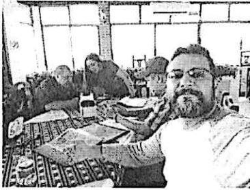
Reunión previo al concierto en el Cuartelón, actual Centro Cultural Mazatenango