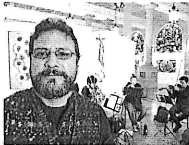
Ensayo Abierto del Cuarteto Primavera en las instalaciones del Palacio Nacional de la Cultura