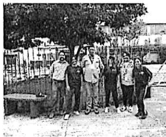
Apoyo logístico en la presentación de propuesta artística la Revuelta, en las instalaciones del INCA